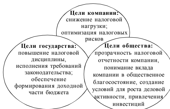
Объединение целей государства, компаний и общества при реализации системного подхода к налоговому планированию

Системная реализация обозначенных мер предполагает наличие в компании специализированного структурного подразделения, в сферу ответственности которого входят: оптимизация налоговой нагрузки компании (на основе законных методов отраженных в официальных документах компании); снижение налоговых и репутационных рисков; повышение эффективности взаимодействия с внешними регуляторами (налоговые инспекции), инвесторами компании и др. Системный подход к налоговому планированию позволяет совместить интересы хозяйствующего субъекта, государства и общества в целом (рисунок).