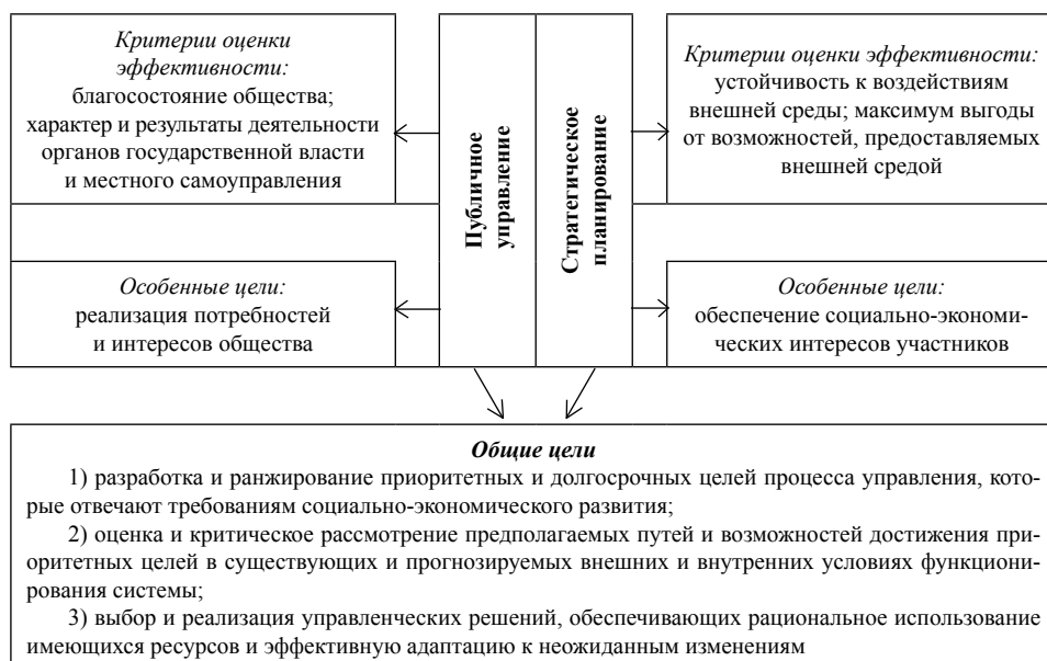
Рис. 2. Общие цели публичного управления и стратегического планирования

Кроме того, в публичном управлении на современном этапе развития используются методы, которые составляют основу стратегического планирования: метод системного анализа, методы стратегической диагностики; метод анализа иерархий, метод привлекательности СЗХ и другие.