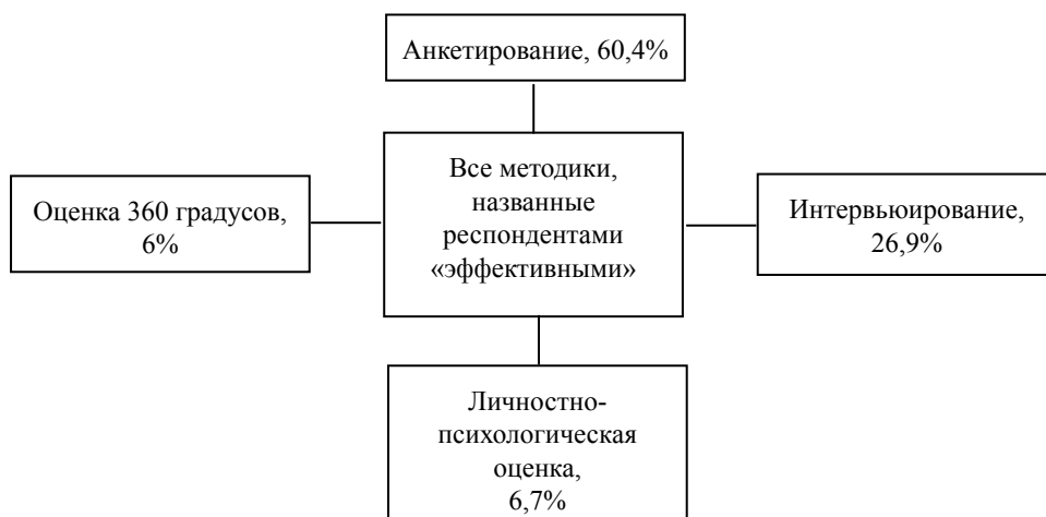
Рис. 1. Анализ наиболее эффективных методик оценки профессионализма сотрудников МФЦ

Следующим аспектом в процессе формирования профессионального стандарта специалиста МФЦ стала дифференциация и анализ методик, по мнению респондентов, демонстрирующих наибольшую эффективность в процессах экспертного оценивания квалифицированности и профессионализма сотрудников МФЦ. Показатели по третьему критерию представлены на рис. 1.