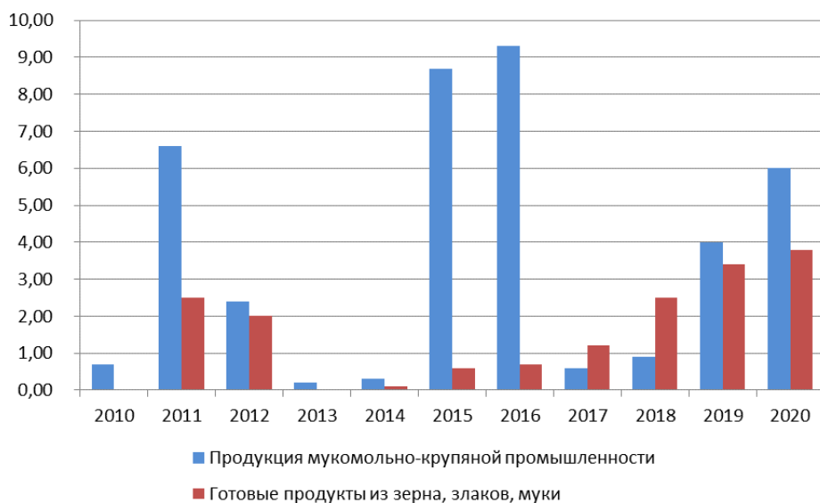
Рис. 3. Объемы экспорта продукции мукомольно-крупяной промышленности и готовых продуктов из зерна, злаков и муки в страны ОПЕК, млн долл. США. Составлено по данным [9]

Распространенной практикой является участие в сбыте произведенной продукции коммерческих посредников, которые как экономические акторы всегда поставляют продукцию мукомольно-крупяной промышленности и готовые продукты из зерна, злаков, муки в места с наиболее выгодными для них ценовыми условиями. Максимальные значения объема экспорта на рис. 3 соответствуют годам, когда спрос на злаковую продукцию в странах ОПЕК был наибольшим, а минимальные значения объема экспорта — когда спрос, а следовательно, и цена были весьма низкими.