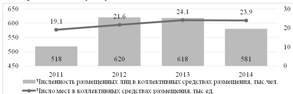
Рис. 2. Показатели деятельности коллективных средств размещения в Алтайском крае

Данные рис. 1. позволяют выявить важную особенность туристско-рекреационного комплекса в регионе — разрыв между спросом (численность размещенных лиц) и предложением (количество мест в коллективных средствах размещения), что связано прежде всего с отсутствием качественного прогнозирования спроса на рынке туристско-рекреационных услуг, а также централизованной и сбалансированной маркетинговой политики. Это характерно для данного комплекса именно в регионах Северо-Кавказского федерального округа. Как показано на рис. 2, в Алтайском крае — регионе с подобными природно-климатическими условиями — разрыв между спросом и предложением практически отсутствует.