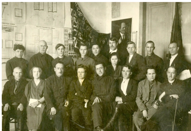
Бюро парторганизации Комвуза. 1928 г.