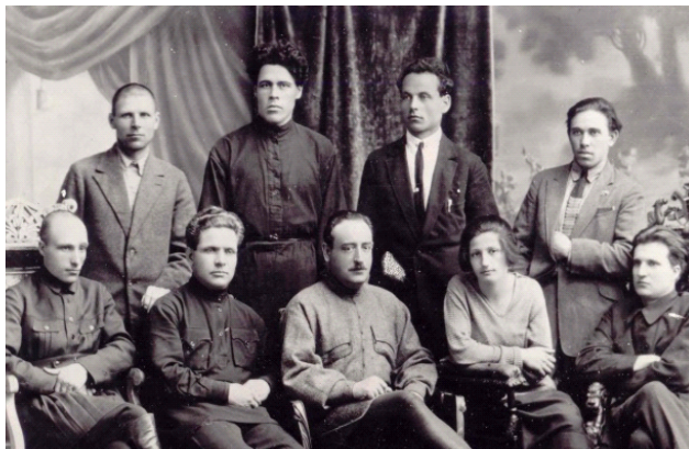
Студенты Комвуза. 1929 г.

27 сентября 1924 г. опыт работы Саратовского Комвуза анализировался на заседании отдела агитации и пропаганды ЦК ВКП(б). В целом деятельность Комвуза оценивалась положительно, но было отмечено, что в учебном плане большое внимание уделяется на первом курсе естествознанию, математике и