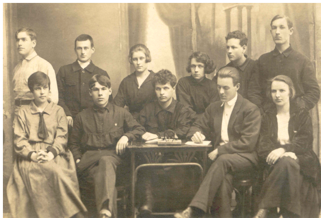
Члены президиума ячейки Комвуза. 1925 г.